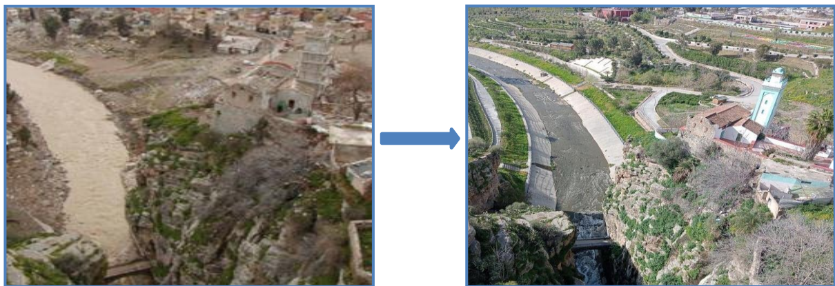
Figure 4 : Valorisation du patrimoine paysager et historique

La valorisation du patrimoine paysager et historique est également partielle. Si le recalibrage de l'Oued Rhumel et la mise en valeur de vestiges comme le mausolée de Sidi Rached sont des succès, des aménagements restent inachevés, laissant place à de nouvelles friches urbaines génératrices d'insécurité.