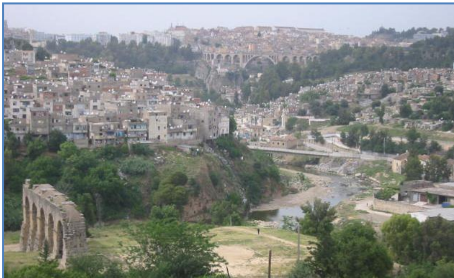
Figure 2 : La zone riveraine avant sa requalification

À l'inverse, la requalification de la zone riveraine s'avère largement superficielle. L'intervention s'est limitée à un ravalement des façades, qualifié par les habitants de « maquillage », sans s'attaquer aux problèmes structurels de vétusté du bâti, d'insalubrité et de manque d'équipements. Cette approche, perçue comme un « effet de façade » (Soulie, 2006) destiné à masquer la misère visible depuis l'hôtel Marriott, a renforcé le sentiment d'abandon des populations riveraines et illustre une priorisation de l'image sur l'amélioration des conditions de vie (Wachter & Emelianoff, 2009).