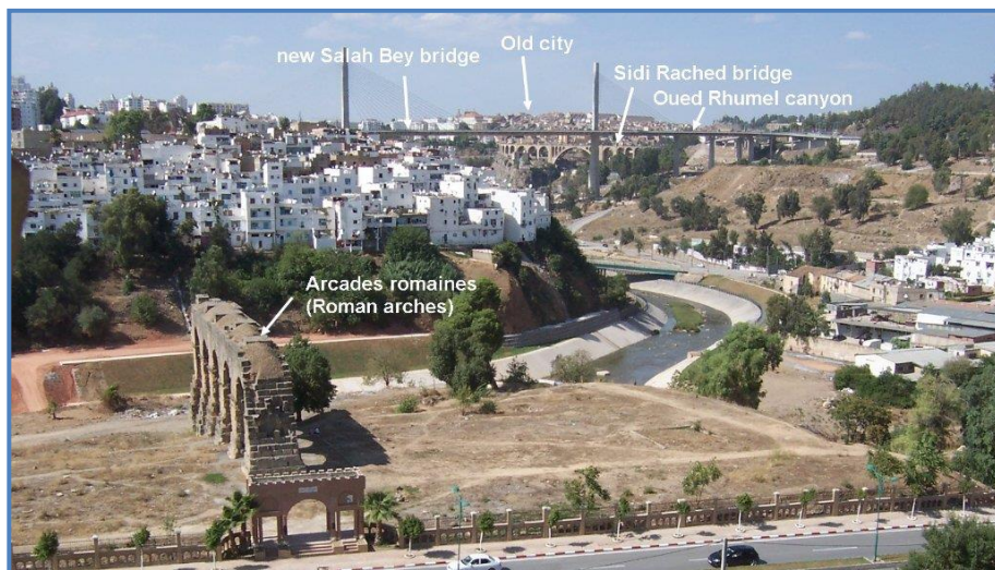
Figure 3 : La zone riveraine après sa requalification