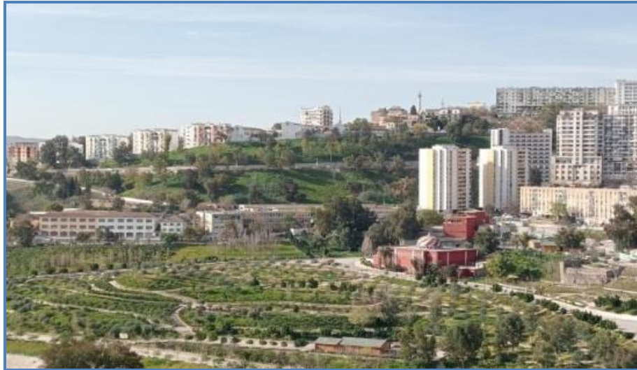
Figure 1 : Friche reconvertie en parc urbain