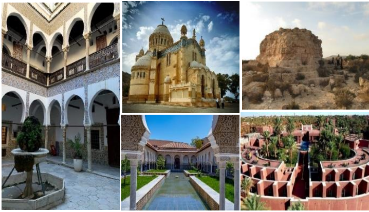
Figure 2. Exemples de monuments historiques classés patrimoine national

peinture, de sculpture et d'art décoratif, ainsi que les éléments religieux, militaires, civils, agricoles ou industriels. Les vestiges préhistoriques, les monuments funéraires, les cimetières, les grottes, les abris sous-roche, les peintures et les gravures rupestres font également partie de cette catégorie, tout comme les monuments commémoratifs et les structures liées aux grands événements de l'histoire nationale. Art-17 ("la loi 98-04 relative à la protection du patrimoine culturel," 15 juin 1998). L'Algérie dispose à cet effet d'environ 282 monuments historiques classés comme patrimoine national répartis dans les diverses parties du territoire algérien.