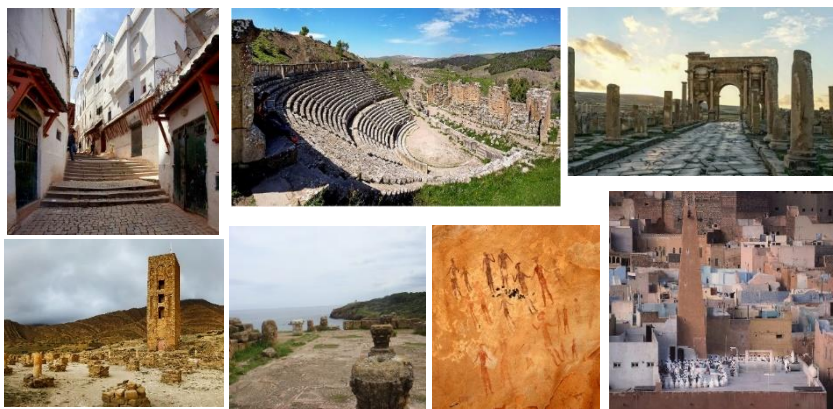
Figure 1. Les sites classés patrimoine mondial

Le patrimoine architectural et urbain en Algérie se trouve parmi le patrimoine culturel matériel immobilier, qui comprend les monuments historiques, les sites archéologiques et les secteurs sauvegardés selon la loi 98-04 ("la loi 98-04 relative à la protection du patrimoine culturel," 15 juin 1998). Sur l'ensemble du riche patrimoine algérien, seuls sept sites sont répertoriés comme patrimoine mondial : Tassili n'Ajjer, les sites archéologiques de Timgad, Djemila et Tipaza, la vallée de M'Zab, la casbah d'Alger et la Qalaa des Beni Hammad. 1