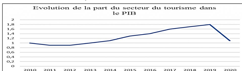
Figure 5. La part du tourisme dans le PIB

La part du tourisme dans le Produit Intérieur Brut 3 (PIB) est restée relativement stable pendant plusieurs années. À partir de l'année 2014, elle a enregistré une croissance continue pour atteindre 1,8 % en 2019. Cependant, en 2020, en raison de la pandémie de Covid-19, elle a chuté à 1,1 %. Selon les dernières déclarations du ministre du Tourisme et de l'Artisanat, M. Didouche Mokhtar, elle a atteint 2 % du PIB hors hydrocarbures en 2023.