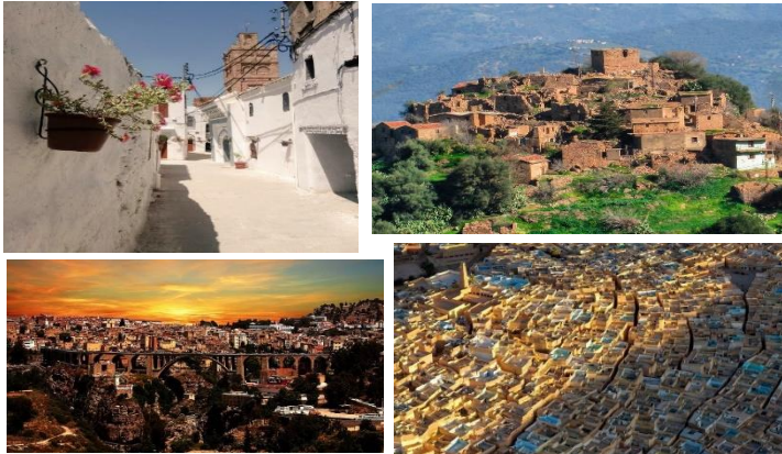
Figure 4. Exemples de secteurs sauvegardés classés en Algérie