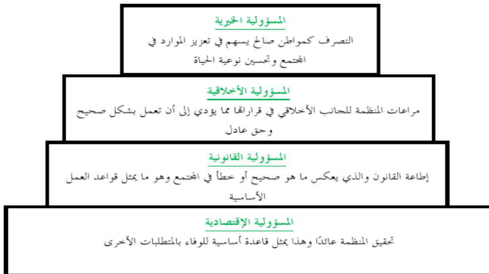
الشكل ( 01): هرم كروول Carroll للمسؤولية الاجتماعية

وحسب كروول CARROL فان المسؤولية الاجتماعية تضم أربعة عناصر جوهرية رئيسية وهي: 9 الاقتصادي Economic، والأخلاقي Ethical، والقانوني Legal، والخيري Philanthropy، وفي هذا الإطار قدم كارول Carroll مصفوفة بين فيها هذه العناصر الأربعة وكيف يمكن ان تؤثر على كل واحد من المستفيدين في البيئة، حيث ان فهم هذه العناصر الأربعة للمسؤولية الاجتماعية يتطلب ايجاد علاقة وثيقة بين متطلبات النجاح في العمل ومتطلبات وتلبية حاجات المجتمع وخاصة في إطار العناصر الاقتصادية والقانونية حيث تمثل هذه العناصر مطالب أساسية للمجتمع من المفترض تلبيتها من قبل منظمات الأعمال. في حين يتوقع المجتمع من منظمات الأعمال ان تلعب دورا اكبر فيما يخص العنصر الاخلاقي والخيري، علما بان هذا الأخير يمثل في حقيقته رغبات مشروعة للمجتمع من المفترض ان تتبناه منظمات الأعمال، وقد وضع كارول هذه العناصر بشكل هرمي متسلسل لتوضيح طبيعة الترابط بين هذه العناصر من جانب ومن جانب آخر فان استناد اي بعد على بعد اخر يمثل حالة واقعية، وكما هو موضح في الشكل التالي :