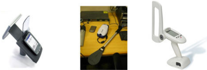
شكل (11) نماذج مختلفة لأدوات الجرد وإدارة المجموعات التي تستخدم في المكتبات 31 .

5. عمليات إدارة المجموعات Collection management: يساعد نظام RFID المكتبات وخصوصا المكتبات التي تحتوي على عدد كبير من المجموعات كالمكتبات العامة والجامعية على إدارة وترتيب مجموعاتها وذلك باستخدام أدوات الجرد الموضحة في الأشكال التالية 30 .