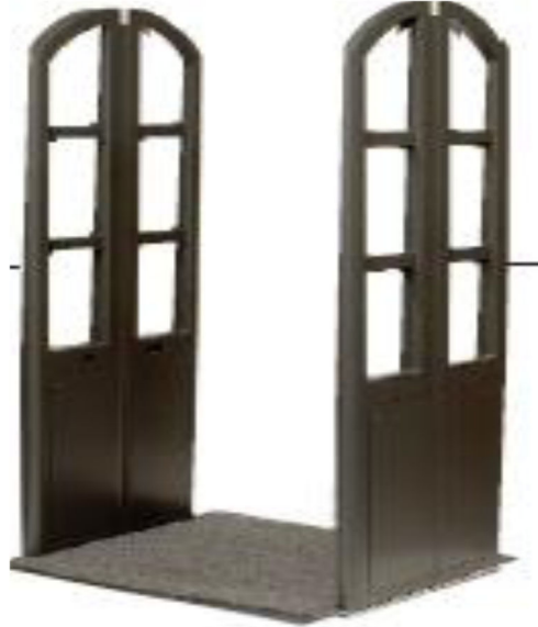
شكل (10) شكل البوابات الأمنية المستخدمة بالمكتبات 29 .

التاج يكون نشط Activated فيحدث صوت الإنذار عند محاولة المرور بين البوابات، أما في حالة حصول المستفيد على الوعاء من خلال جهاز الإعارة الذاتية أو موظفي الإعارة فإن ذلك يبطل نشاط التيجان Deactivated، وحينها يستطيع المستفيد المرور بالوعاء من البوابات الأمنية دون حدوث إنذار. ومن أشكال هذه البوابات: