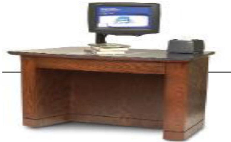
شكل (6) أحد أجهزة الإعارة الذاتية بالمكتبات 27 .

توفير الوقت الخاص بعمليات الإعارة لاستغلاله في أداء خدمات وأنشطة أخرى للمستفيدين بالمكتبة كالرد على الاستفسارات، بالإضافة إلى توفير الخصوصية للمستعير Patron privacy حيث تمكن المستعير من استعارة المواد التي يريدونها أيا كانت بخصوصية تامة؛ وغيرها من الخدمات الأخرى التي يمكن أن يقدمها أخصائيو المكتبة للمستفيدين 26 ، ويقدم موردو أنظمة FID R للمكتبات أنواع وأشكال متعددة من وحدات الإعارة الذاتية ومنها ما يلي: