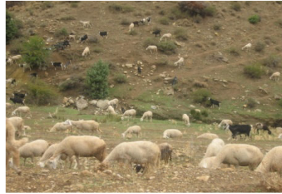
صورة (01): الرعي في جبال بلزمة