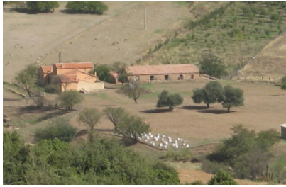
صورة (02): السكان داخل الحظيرة

2-2- الخصائص البشرية: يبلغ عدد سكان المحيطين بالحظيرة الوطنية بلزمة حوالي 392675 نسمة حسب إحصائيات الديوان الوطني للإحصاء لسنة 2008 يتوزعون على عدة دوائر وبلديات محيطة بالحظيرة، وعلى العموم حظيرة بلزمة تابعها فلاحي رعوي لانعدام القطاع الصناعي وضعف قطاع الخدمات من جهة، فمعظم نشاطات السكان هي رعي الأبقار بالدرجة الأولى واستغلال المساحات الزراعية القليلة الموجودة على حواف الجبال خصوصا بعد المشاريع التنموية التي قامت بها إدارة الحظيرة في تشجيع غرس الأشجار المثمرة بالمنطقة، وبالنسبة للسياحة رغم الإمكانيات الطبيعية والتاريخية التي تتوفر عليها حظيرة بلزمة إلا أنها تكاد تكون معدومة -عدا الزوار المحليين- بسبب عدم اهتمام السلطات وإدارة الحظيرة على تطويرها عكس بقية الحظائر التي نجدها قبلة مهمة للسياحة في الجزائر.