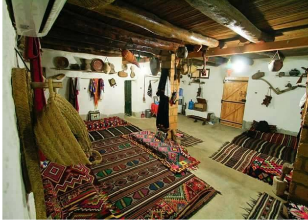
متحف عزوز بن سي عمر الخاص بفسيرة لحماية وحفظ تراث الاوراس